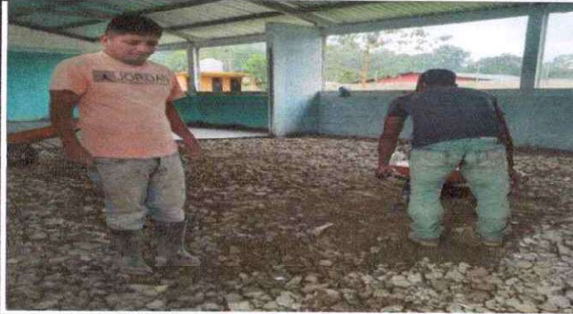
Foto1: Sustitucion TORTA DE CEMENTO LIQUIDO