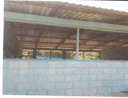
Foto 2: sustitucion de estructura de soporte de madera por metal.