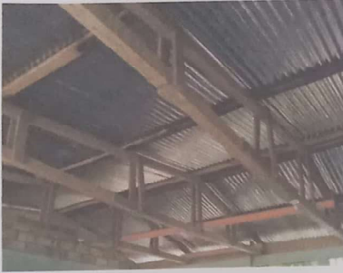
Foto 1: Sustrucción de estructura de soporte de madera, por metal.