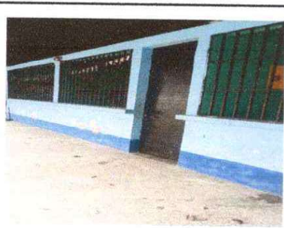
Foto 10 Puertas