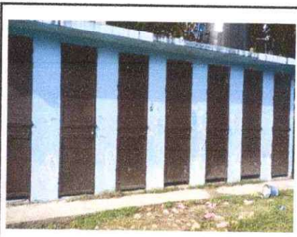
foto 7 Puertas de sanitarios