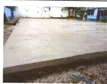
Foto 9 Parte de la cancha de Basquetbol