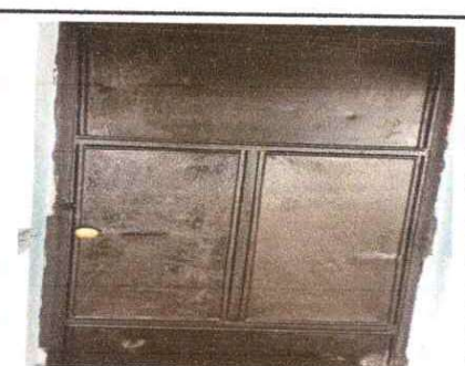
Foto 12, Cambio de chapas

Observación: Si es necesario se pueden agregar hojas adicionales y actualizar el número de hojas.