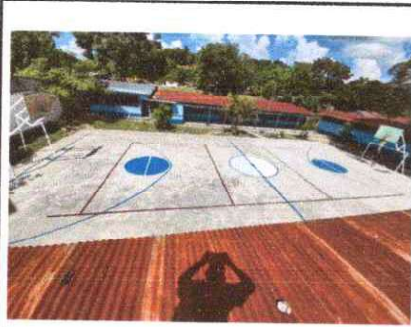
Foto. 7 Cancha de basquetbol