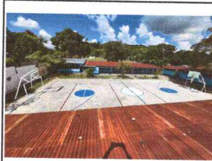
Foto 8 Parte de la cancha de Basquetbol