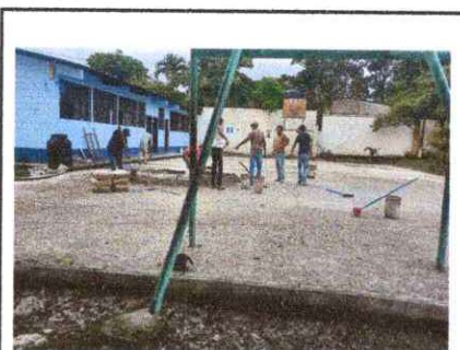
Foto 9 Parte de la cancha de Basquetbol