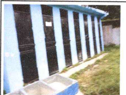
foto 10 Puertas de sanitarios