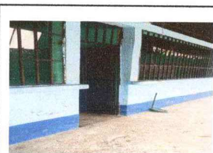
Foto 11 Puertas