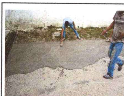
Foto 8 Parte de la cancha de Basquetbol