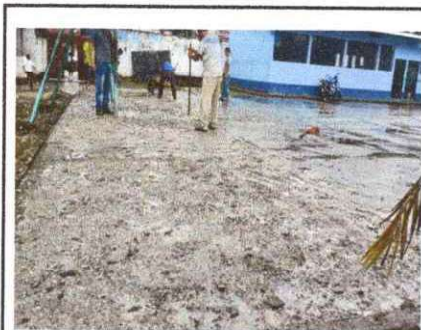
Foto 7 Cancha de basquetbol