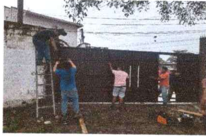
Foto1: Porton de ingreso, lado este.