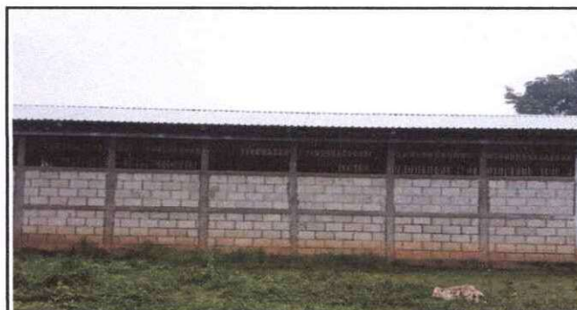
Foto 6: Sustitución de Ventanas con Maya Metalica por Balcones de Metal

Observación: Si es necesario se pueden agregar hojas adicionales y actualizar el número de hojas.