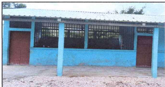
Foto 5: Sustitución de Ventanas con Maya Metalica por Balcones de Metal