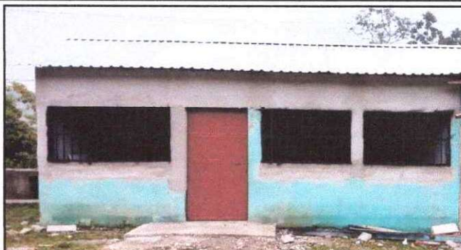
Foto 2: Sustitución de Estructura de Madera por Estructura de Metal y lámina troquelada aluzinc calibre 26 parte frontal