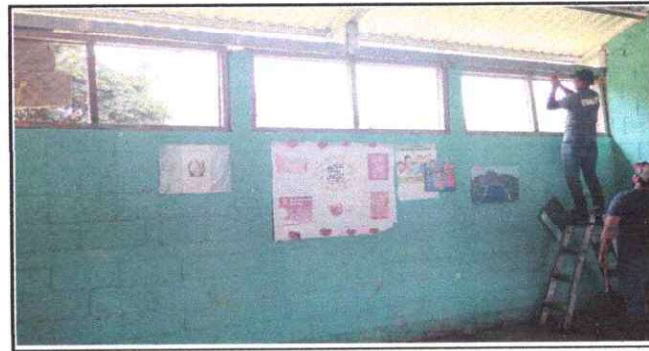
Foto 6: Sustrucción de Ventanas con Maya Metalica por Balcones de Metal

Observación: Si es necesario se pueden agregar hojas adicionales y actualizar el número de hojas.