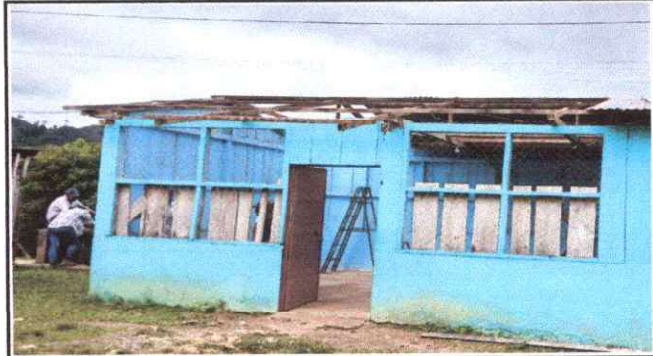
Foto 2: Sustrucción de Estructura de Madera por Estructura de Metal y lámina troquelada aluzinc calibre 26 parte frontal