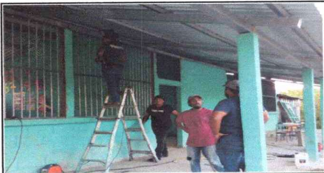
Foto 5: Sustrucción de Ventanas con Maya Metalica por Balcones de Metal