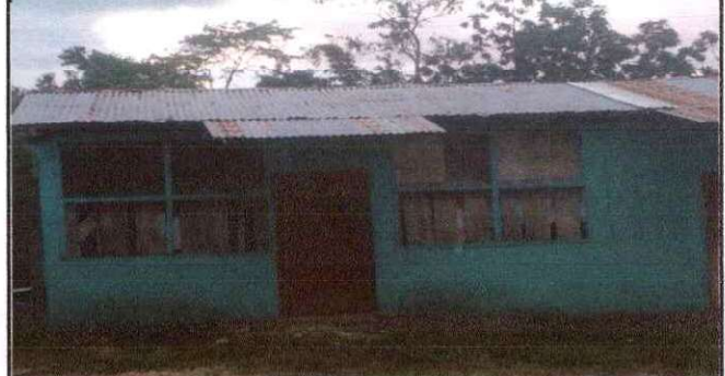
Foto 2: sustitucion de estructura de soporte de madera por metal.