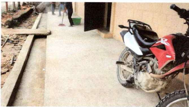
Foto 3: Sustitución de torta de cemento en mal estado. Por torta de cemento rústico y reparación de cuneta