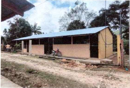
Foto 1: instalación finalizada de láminas en dos de las aulas del centro educativo