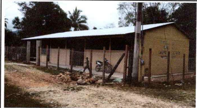
Foto 4: Colocación de cerco de alambre de puas y malla metálica en área perimetral de la escuela.