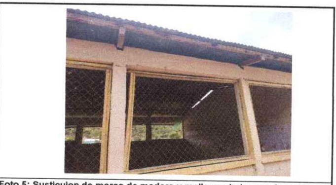
Foto 5: Susticucion de marco de madera y malla por balcones de metal