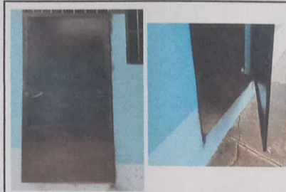
Foto 1. Fabricación e instalación de puertas de metal en módulos