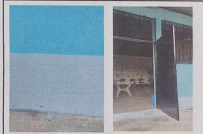
Foto 2. Pintura en muros exteriores e interiores.