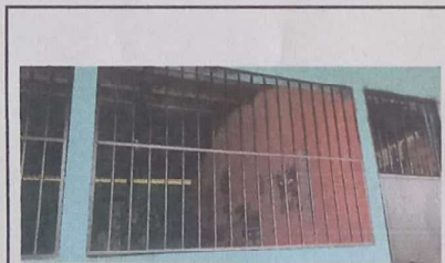
Foto 3. Fabricación e instalación de ventana-balcon de metal

Observación: Si es necesario se pueden agregar hojas adicionales y actualizar el número de hojas.