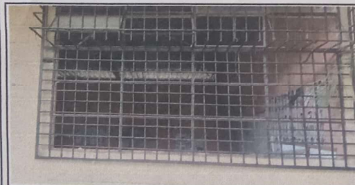
Foto 3. Fabricación e instalación de ventana-balcon de metal

Observación: Si es necesario se pueden agregar hojas adicionales y adjuntar fotos.