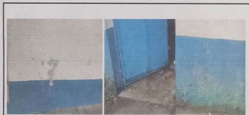
Foto 2. Pintura en muros exteriores e interiores.