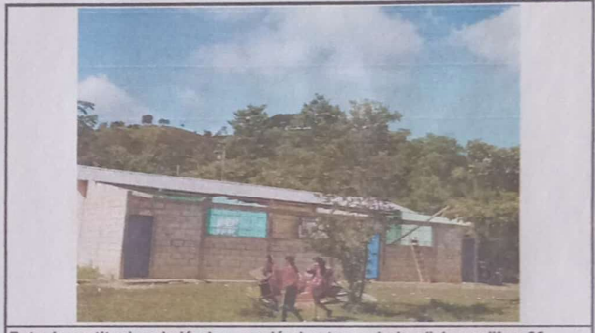
Foto 4: sustitucion de lámina, por lámina troquelada aillzinc calibre 26