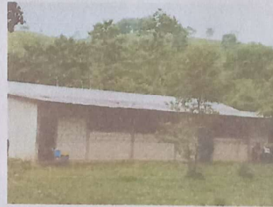
Foto 4: Sustitución de lámina, por lámina troquelada alizinc calibre 26