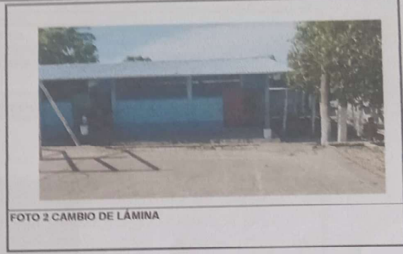
FOTO 2 CAMBIO DE LÁMINA