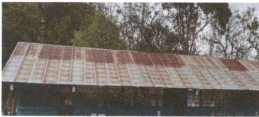
Foto 3: 1.1 Sustitución de lámina, por lámina troquelada aluzinc calibre 26, 1.2 Sustitución de capote de lámina para lámina troquelada y 1.3 Sustitución de elementos de fijación.