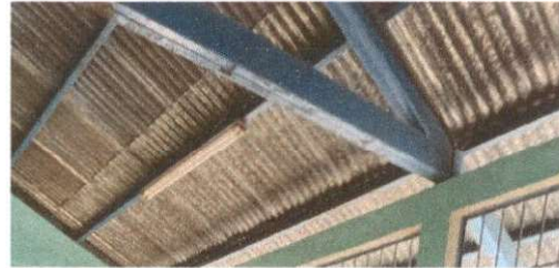
Foto 2: 17.11 Reparación de cableado eléctrico, 17.12 Sustitución de ducto eléctrico + accesorios y 17.1 Sustitución de tablero de filipones.