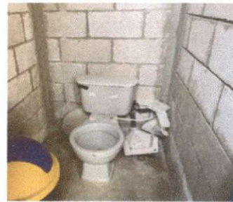
Foto 4: Sustitución de accesorios inodoro (contra llave, tubo de abasto y tanque) y 10.5 Sustitución lavamanos