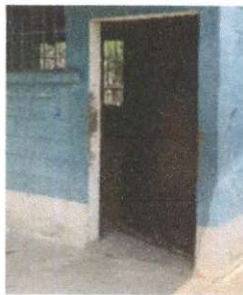
Foto 5: 4.1 Mantenimiento a estructura (lijado, cambio de tubo cepillado, sujeciones, aplicación de pintura)