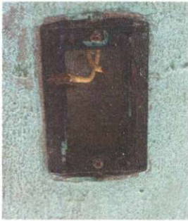
Foto1: 17.7 Sustitución interruptores dobles y 17.8 Sustitución de tomacorrientes dobles