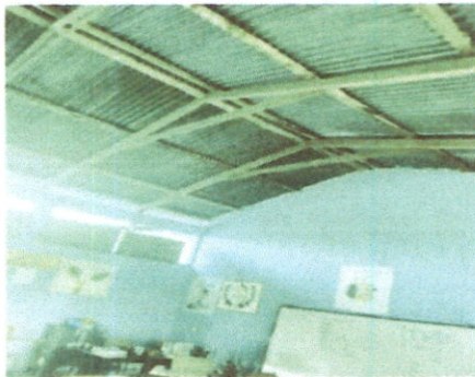
Foto1: parte interna