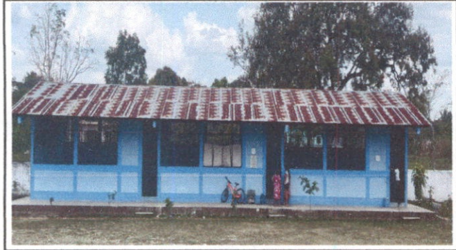
Foto1: Sustitución de lámina, por lámina troquelada aluzinc calibre 26.