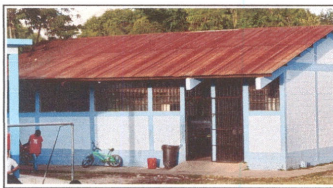
Foto 3: Sustitución de lámina, por lámina troquelada aluzinc calibre 26.