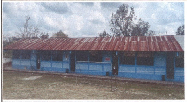
Foto 2: Sustitución de lámina, por lámina troquelada aluzinc calibre 26.