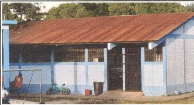
Foto 3: Sustitución de lámina, por lámina troquelada aluzinc calibre 26.