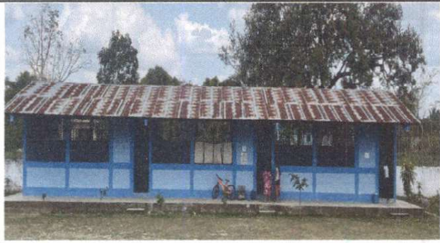
Foto 1: Sustitución de lámina, por lámina troquelada aluzinc calibre 26.