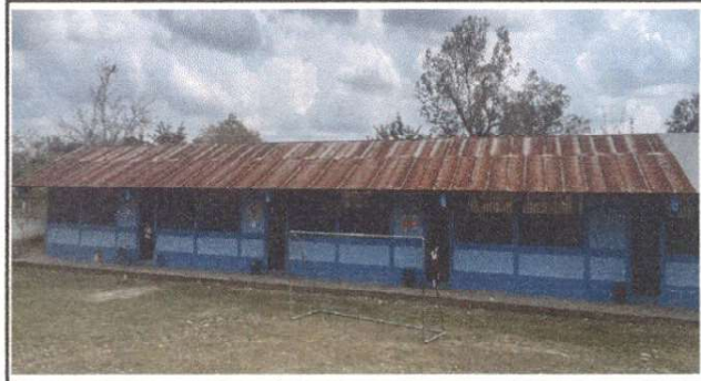
Foto 2: Sustitución de lámina, por lámina troquelada aluzinc calibre 26.