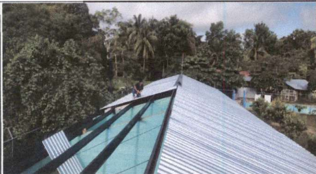
Foto1: Sustitución de lámina, por lámina troquelada aluzinc calibre 26.