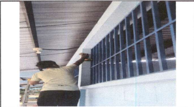
Foto 3: Fabricación e instalación de balcones de hierro en ventana.