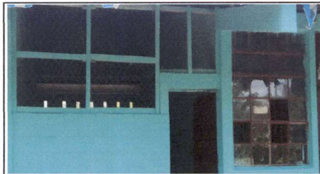
Foto 3: Fabricación e instalación de balcones de hierro en ventana.