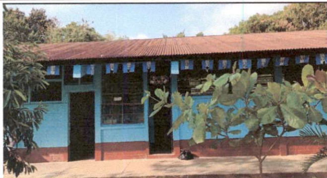
Foto1: Sustitución de lámina, por lámina troquelada aluzinc calibre 26.