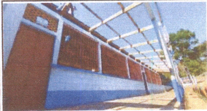
Foto 1: Sustitución de láminas y vigas de madera de dos aulas, bodega y biblioteca.