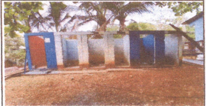
Foto 4: Durante el proceso de eliminación de elementos a sustituir en el área de baños.