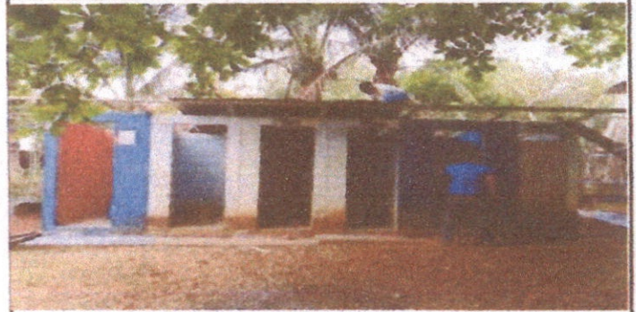
Foto 2: Sustitución de láminas, vigas de madera y puertas en el área de baños.