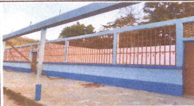
Foto 3: Durante el proceso de eliminación de elementos a sustituir en aulas, bodega y biblioteca.