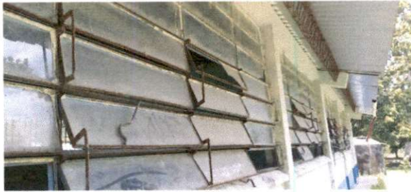
Foto1: Mantenimiento de estructura de metal de ventana