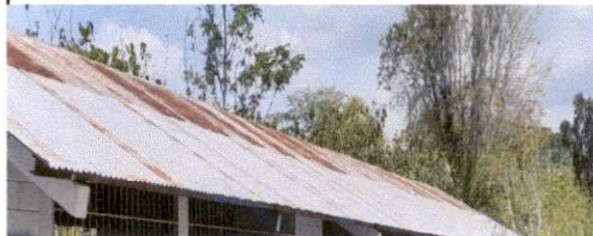
Foto 6: Sustitución de lámina, por lámina troquelada aluzinc calibre 26

Observación: Si es necesario se pueden agregar hojas adicionales y actualizar el número de hojas.