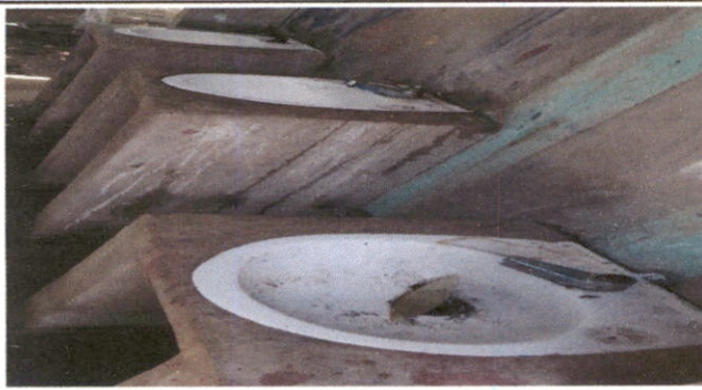
Foto 3: Sustitución de mezcladora lavamanos (contra llave, tubo de abasto).