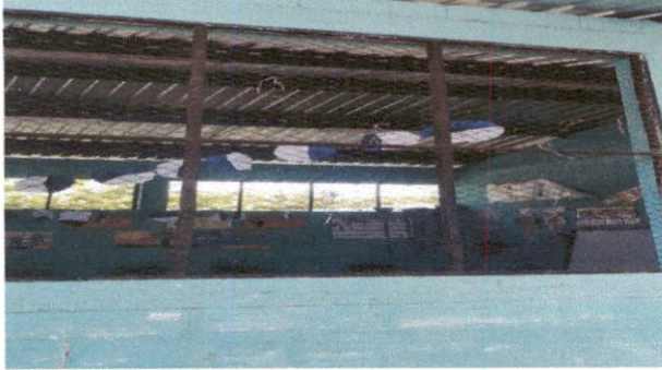
Foto1: PINTURA EN MUROS INTERIORES Y EXTERIORES.