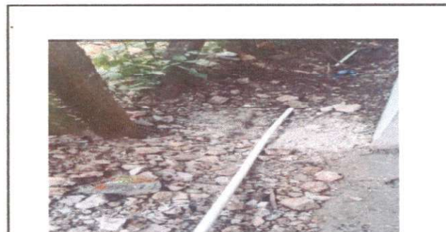
Foto 12: Sustitución de tubería línea principal con yave de paso y chorro

Observación: Si es necesario se pueden agregar hojas adicionales y actualizar el número de hojas.