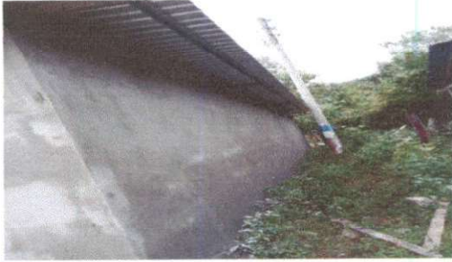
Foto1: Sustrucción de lamina, por lamina troquelada aluzinc calibre 26 en cocina