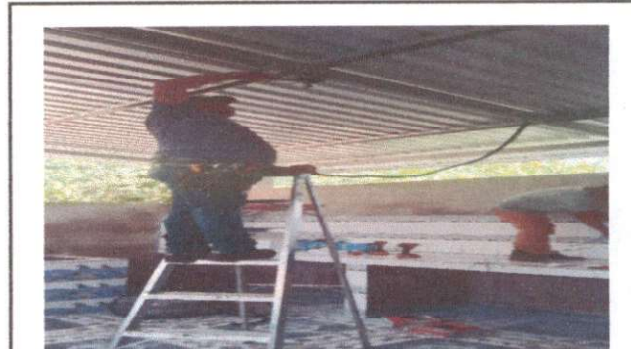
Foto 10: Instalación de unidades de luz y fuerza (incluye interruptor, plafonera, foco, tomacorriente, ducto y cable eléctrico)