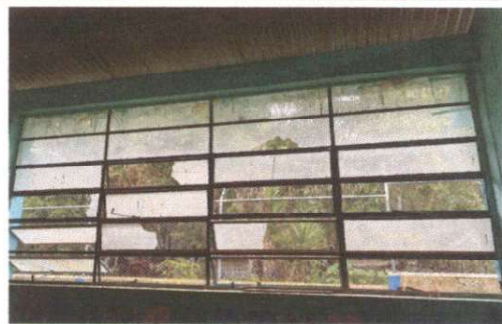
FABRICACION E INSTALACIÓN DE BALCON DE HIERRO EN VENTANA

Observación: Si es necesario se pueden agregar hojas adicionales y actualizar el número de hojas.