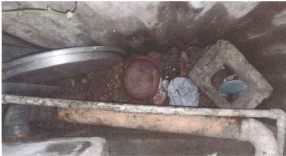
SUSTITUCIÓN DE TUBERÍA PRINCIPAL