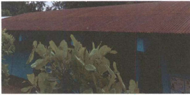
SUSTITUCIÓN DE LAMINA, POR LAMINA TROQUELADA ALIZING CALIBRE 26