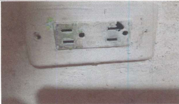
SUSTITUCIÓN DE TOMACORRIENTES DOBLE