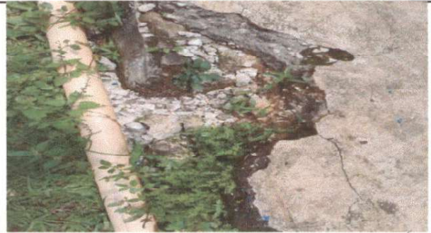
SUSTITUCIÓN DE TUBERIA PRINCIPAL AGUAS NEGRAS