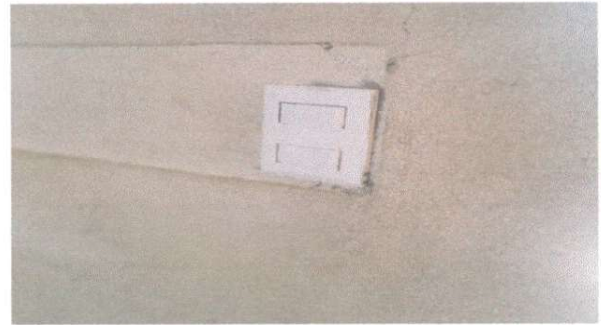
SUSTITUCIÓN DE INTERRUPTORES DOBLES