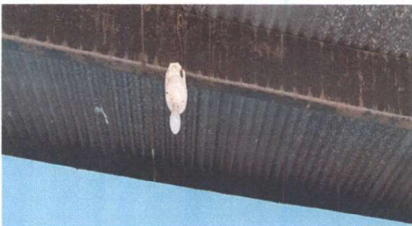
SUSTITUCIÓN DE PLAFONERA