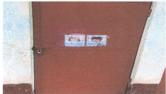
SUSTITUCIÓN DE PUERTAS