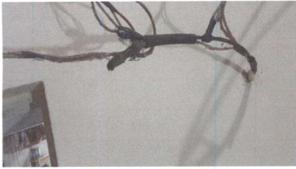
SUSTITUCIÓN DE CABLEADO PRINCIPAL