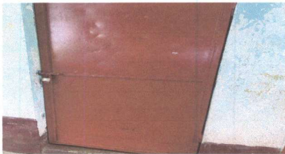
MANTENIMIENTO A ESTRUCTURA DE METAL

Observación: Si es necesario se pueden agregar hojas adicionales y actualizar el número de hojas.