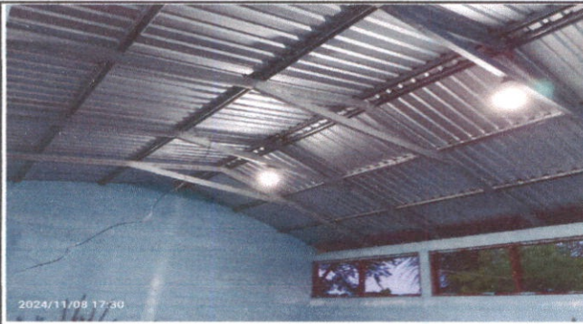
Foto1: SUSTITUCION SISTEMA ELECTRICO