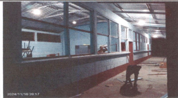
Foto1: SUSTITUCION DE MARCOS DE VENTANA