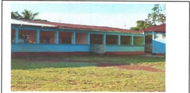
Foto1: Sustitución de lámina, por lámina troquelada aluzinc calibre 26 del Centro Educativo