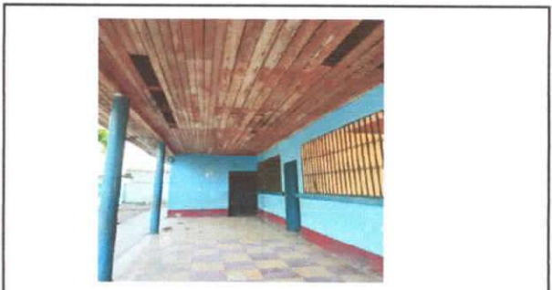
Foto 3: Sustitución de elementos de fijación del Centro Educativo