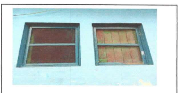
Foto 6: Fabricación e instalación de ventana-balcon de metal del Centro Educativo

Observación: Si es necesario se pueden agregar hojas adicionales y utilizar el número de hojas.