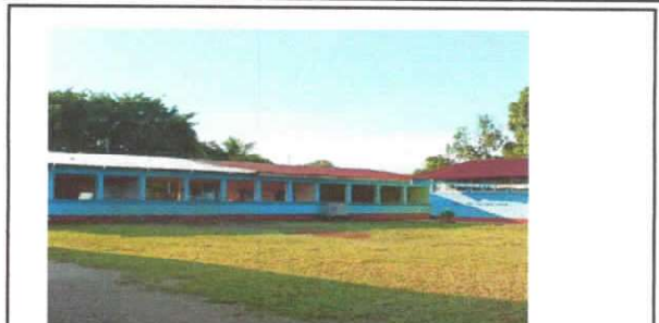
Foto 2: Sustitución de capote de lámina para lámina troquelada del Centro Educativo