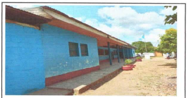
Foto 4: Sustitución de estructura de soporte de madera por metal del Centro Educativo