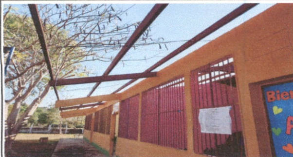
Foto1: Cubierta de lámina