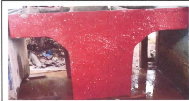
Foto7: SUSTITUCIÓN DE PILA DE CEMENTO DE DOS LAVADEROS