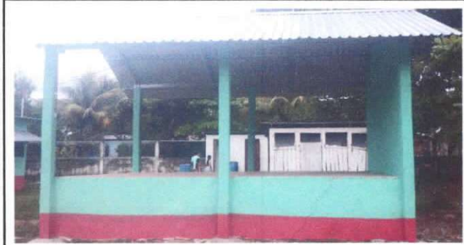
Foto 1: SUSTITUCIÓN DE LÁMINA, POR LÁMINA TROQUELADA ALUZING CALIBRE 26