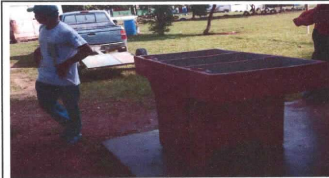
Foto7: SUSTITUCIÓN DE PILA DE CEMENTO DE DOS LAVADEROS