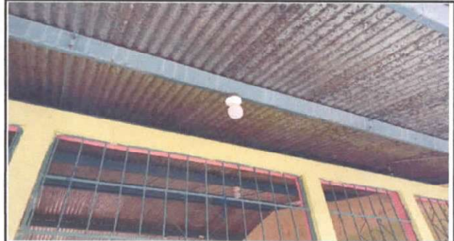
SUSTITUCION DE PLAFONERAS