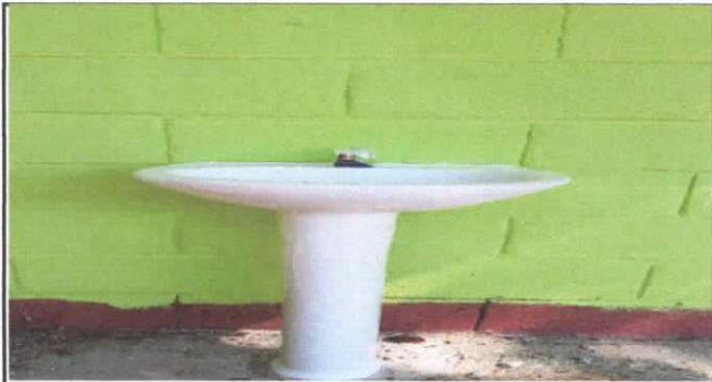
SUSTITUCION DE LAVAMANOS