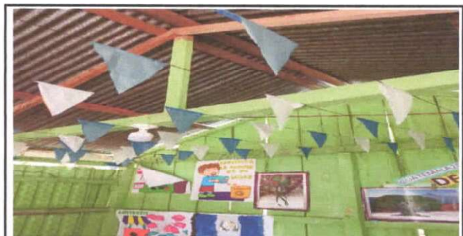
REPARACION DE CABLEADO ELECTRICO

Observación: Si es necesario se pueden agregar hojas adicionales y actualizar el número de hojas.