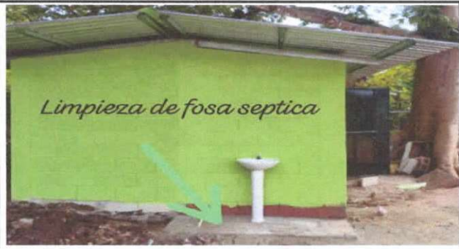
LIMPIEZA DE FOSA SEPTICA