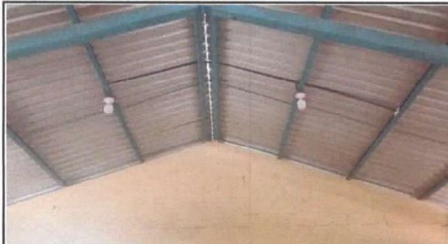
SUSTITUCION DE DUCTO ELECTRICO + ACCESORIOS