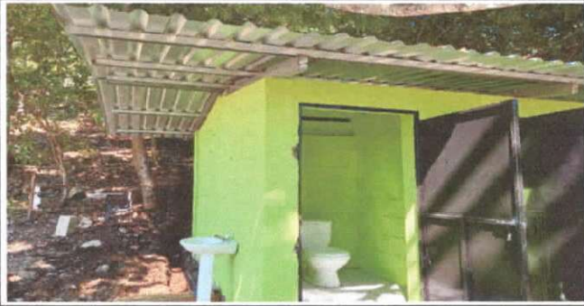
SUSTITUCION DE ESTRUCTURA DE SOPORTE DE METAL POR METAL

Observación: Si es necesario se pueden agregar hojas adicionales y actualizar el número de hojas.