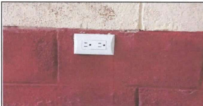
SUSTITUCION DE TOMACORRIENTES