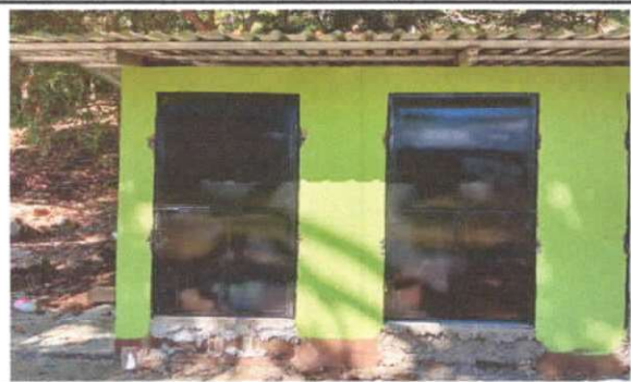
FABRICACION E INSTALACION DE PUERTA DE METAL EN BAÑOS