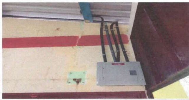
SUSTITUCION DE TABLERO DE FLIPONES