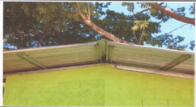
SUSTITUCION DE CAPOTE DE LAMINA PARA LAMINA TROQUELADA