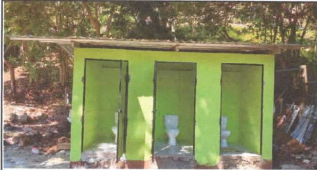
SUSTITUCION DE LAMINA, POR LAMINA TROQUELADA ALIZINC CALIBRE 26