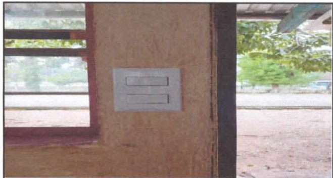
SUSTITUCION DE INTERRUPTORES DOBLE