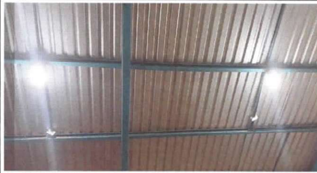
SUSTITUCION DE FOCOS AHORRADORES