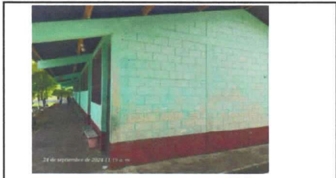
Foto 4: PINTURA EN MUROS EXTERIORES E INTERIORES, Pintura en muros exteriores e interiores