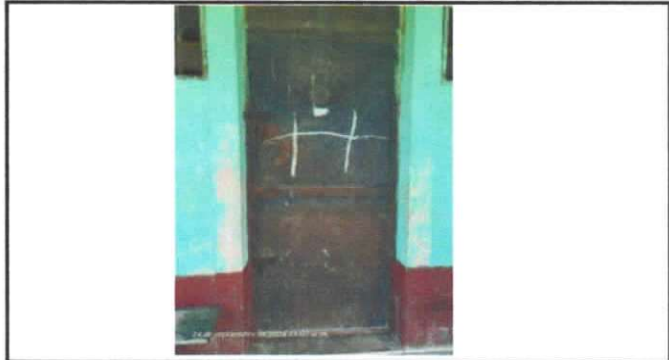
Foto 2: PUERTAS DE METAL, Mantenimiento a estructura (lijado, cambio de tubo , cepillado, sujeciones, aplicación de pintura)