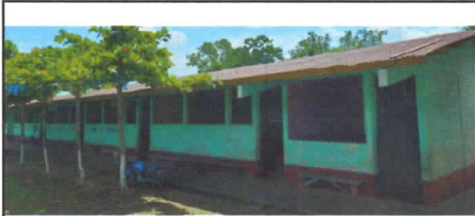
Foto 1: CUBIERTA DE LAMINA, Sustitución de lámina, por lámina troquelada aluzinc calibre 28, Sustitución de capote de lámina para lámina troquelada, Sustitución de elementos de fijacion