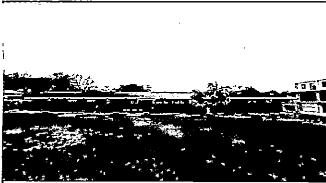
Foto1: Cambio de lámina de 4 aulas, 2 bodegas y 2 filas de baños.