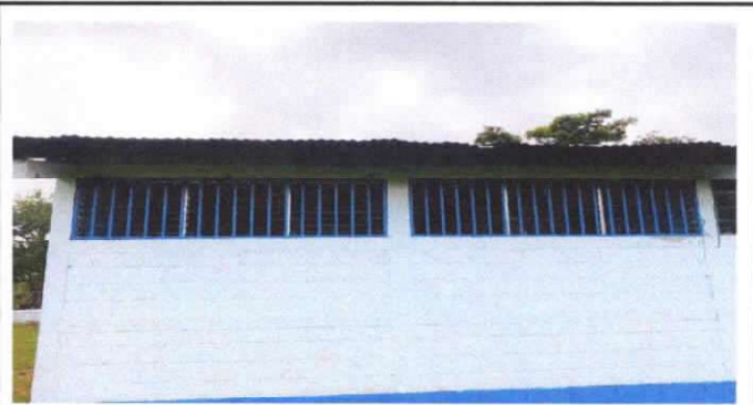
sustitución de balcon de metal en ventana