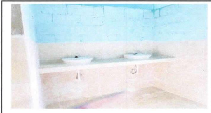
sustitución de lavamanos