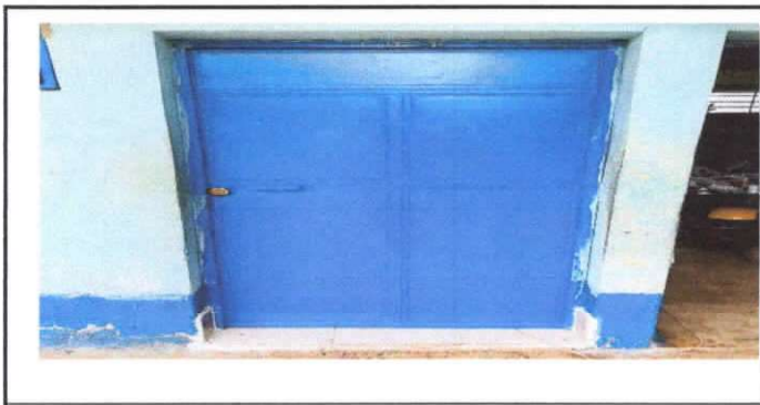
mantenimiento a puertas