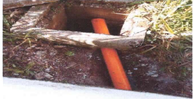
sustitución de tubo PVC linea principal de drenaje aguas negras