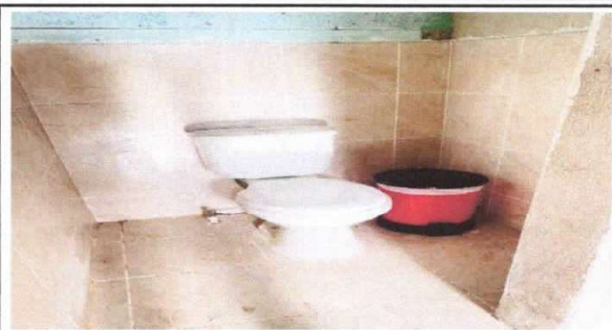
sustitución de inodoros