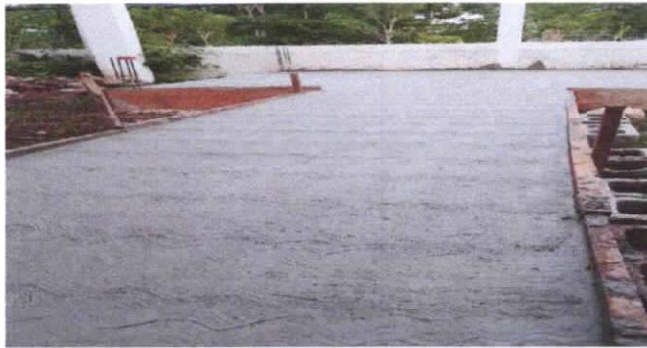
sustitución de piso de torta de concreto