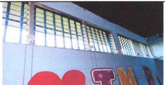
mantenimiento a marcos de aluminio

Observación: Si es necesario se pueden agregar hojas adicionales actualizando el número de hojas.