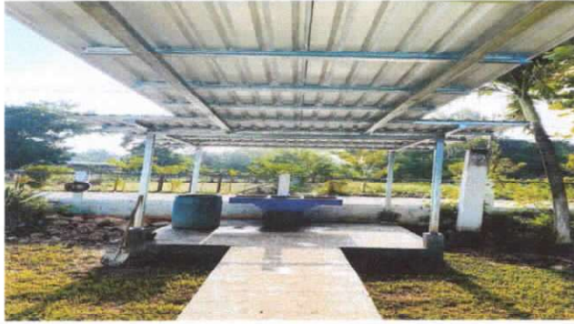
sustitución de lamina troquelada aluzinc calibre 26