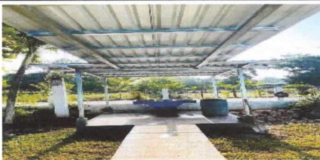
sustitución de estructura de soporte de metal, por metal