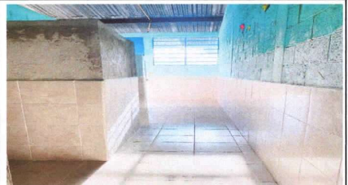
Reparación de muro de contención