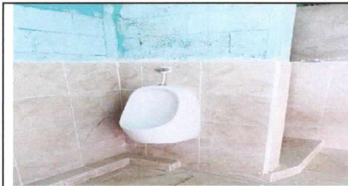
sustitución de migitorios