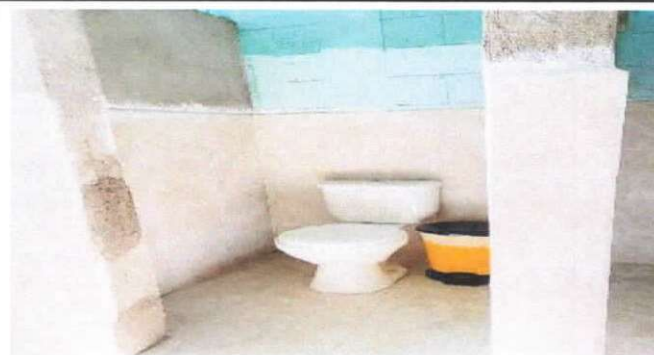
sustitución de inodoros