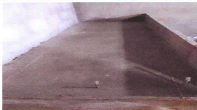
sustitución de piso de torta de concreto