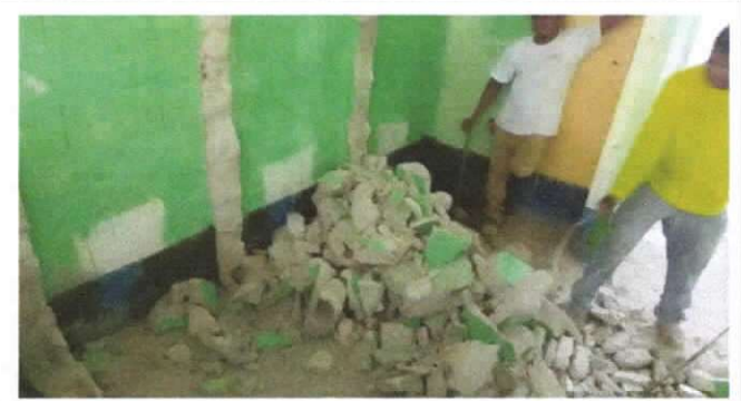
Reparación de muro de contención