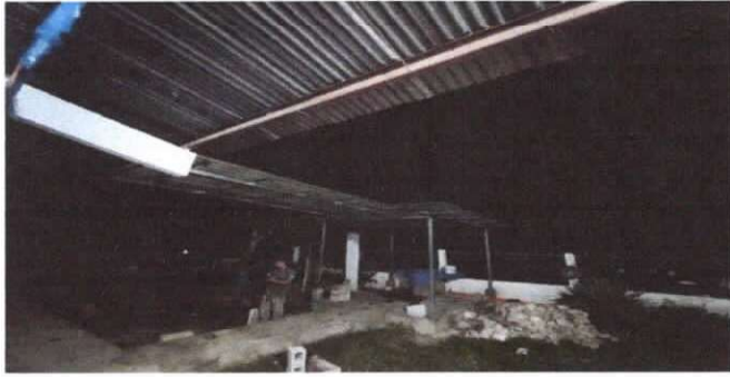
sustitución de lamina troquelada aluzinc calibre 26