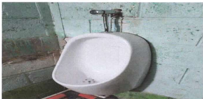
sustitución de migitorios