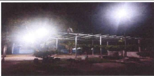
sustitución de estructura de soporte de metal, por metal