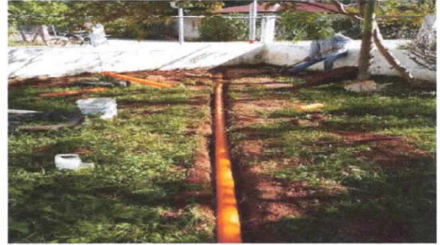
sustitución de tubo PVC línea principal de drenaje aguas negras