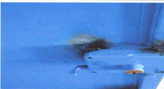
sustitución de chapas

Observación: Si es necesario se pueden agregar hojas adicionales y actualizar el número de hojas.