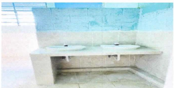
sustitución de lavamanos