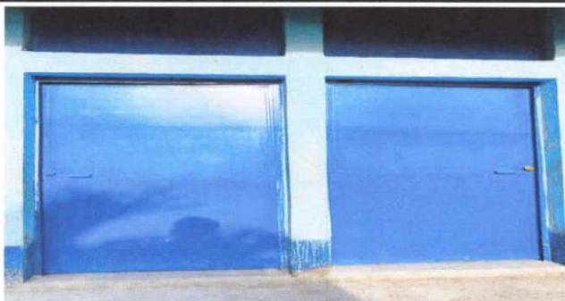
mantenimiento a puertas