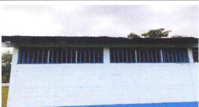
mantenimiento a marcos de aluminio

Observación: Si es necesario se pueden agregar hojas adicionales y actualizar el número de hojas.