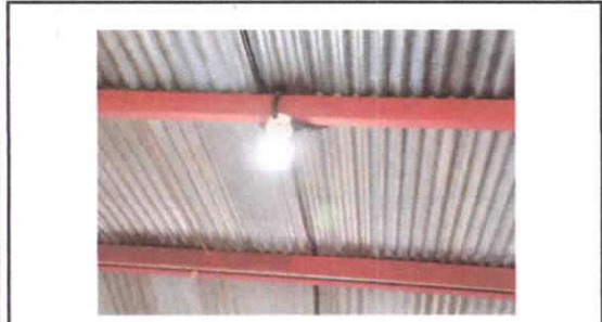
Foto1: Sustritiución de focos ahorradores