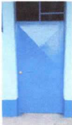
Foto 9: Mantenimiento a estructura (lijado, cambio de tubo, cepillado, sujeciones, aplicación de pintura)