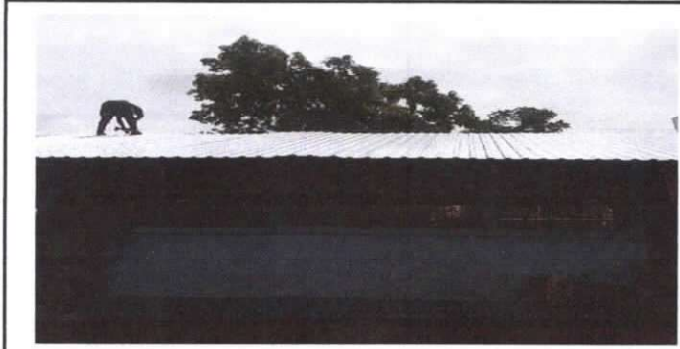
SUSTITUCIÓN DE LAMINA, POR LAMINA TROQUELADA ALUZINC CALIBRE 26