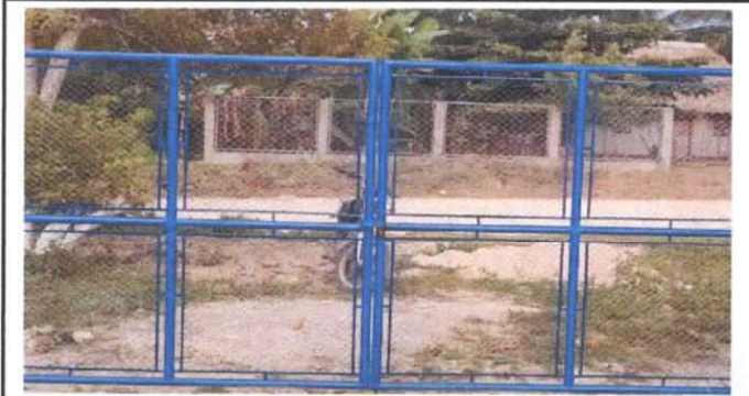
MANTENIMIENTO A PORTON DE METAL