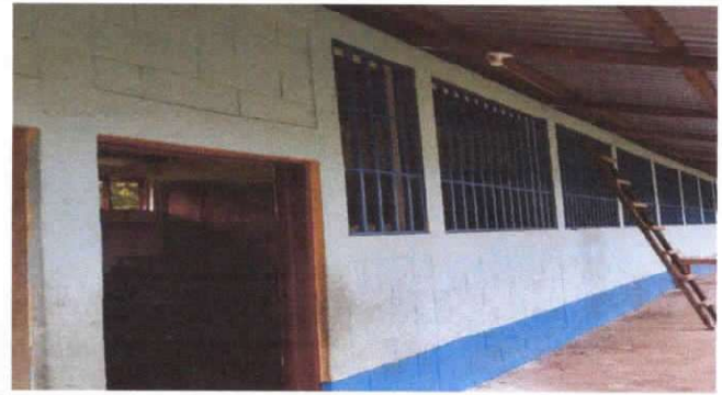
SUSTITUCIÓN DE BALCON DE METAL POR METAL