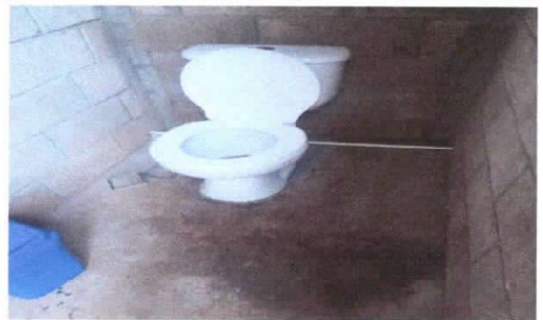
SUSTITUCIÓN DE INODORO