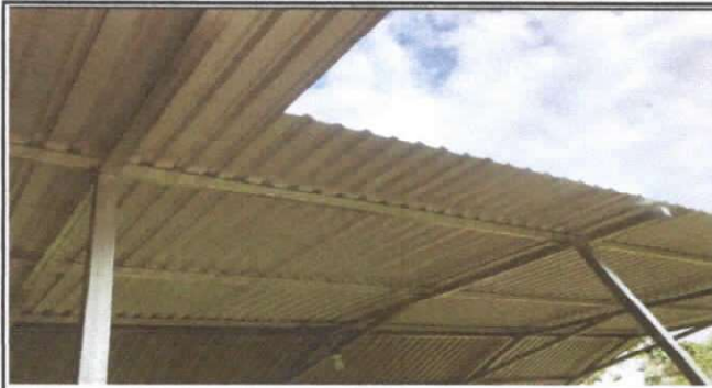
SUSTITUCION DE LAMINA, POR LAMINA TROQUELADA ALUZINC CALIBRE 26