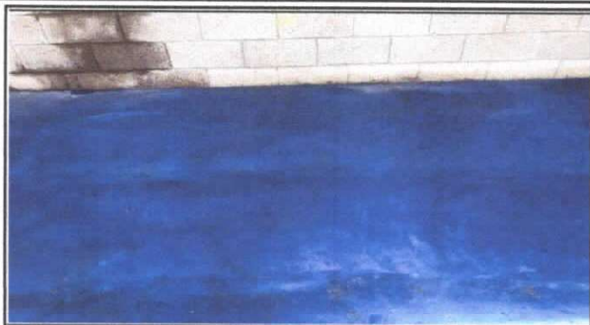
SUSTITUCION DE PISO DE TORTA DE CONCRETO