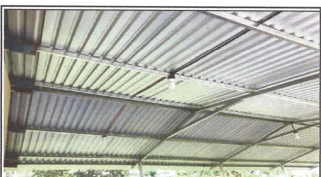
SUSTITUCION DE ESTRUCTURA DE SOPORTE DE MADERA, POR METAL