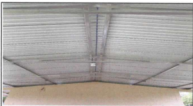
SUSTITUCION DE CAPOTE DE LAMINA PARA LAMINA TROQUELADA