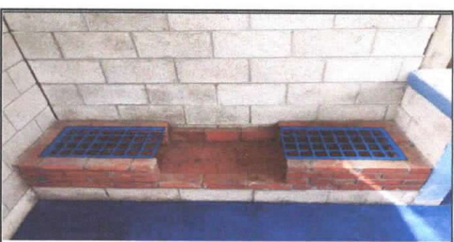
MANTENIMIENTO A ESTUFA RURAL

Observación: Si es necesario se pueden agregar hojas adicionales y actualizar el número de hojas.