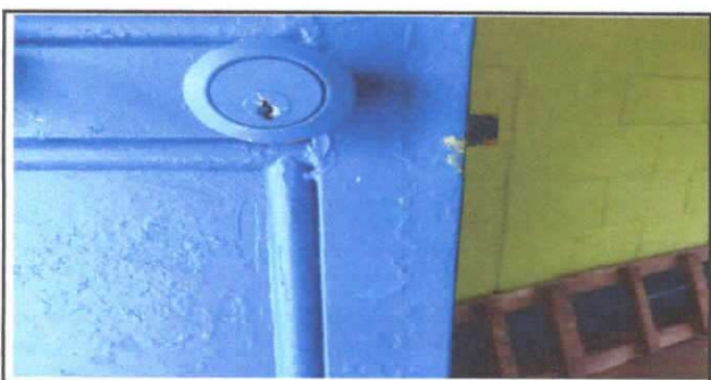
SUSTITUCION DE CHAPA