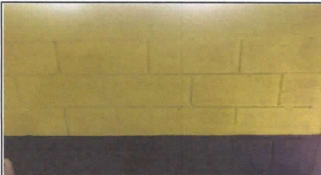
PINTURA EN MUROS EXTERIORES E INTERIORES