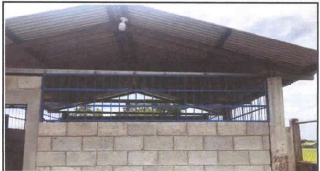
FABRICACION E INSTALACION DE BALCONES DE HIERRO EN VENTANAS