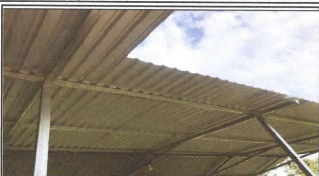
SUSTITUCION DE LAMINA, POR LAMINA TROQUELADA ALUZINC CALIBRE 26