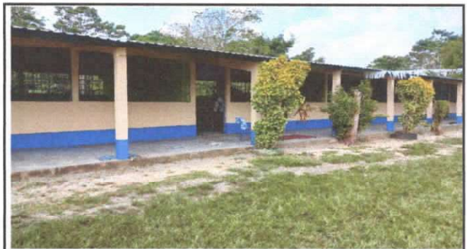
PINTURA EN MUROS EXTERIORES E INTERIORES