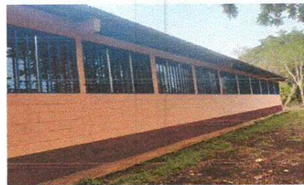
Foto 6: Persianas en la parte de atrás de aulas de primero, segundo y tercero básico.

Observación: Si es necesario se pueden agregar hojas adicionales y actualizar el número de hojas.