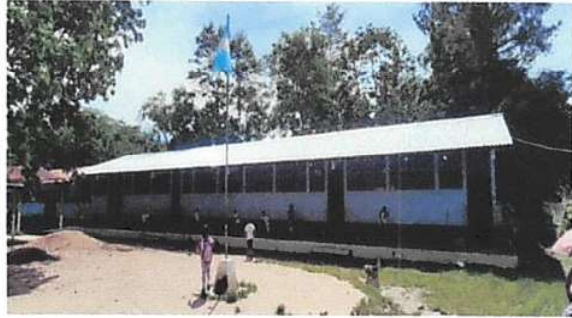
Foto 1: Sustitución de lámina, por lamina troquelada aluzinc calibre 26