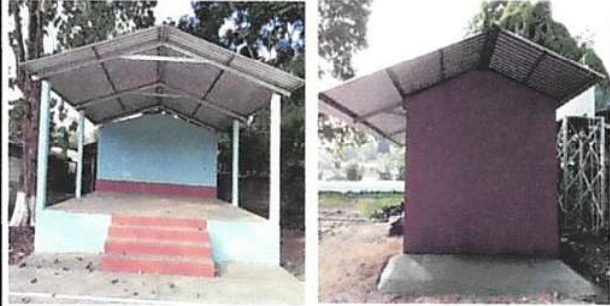
Foto 2: Sustitución de estructura de soporte de madera, por metal