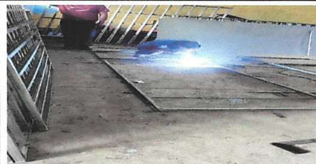
Foto 2: 4. Puertas de metal: 4.4 Sustitución de puerta en servicios sanitarios.