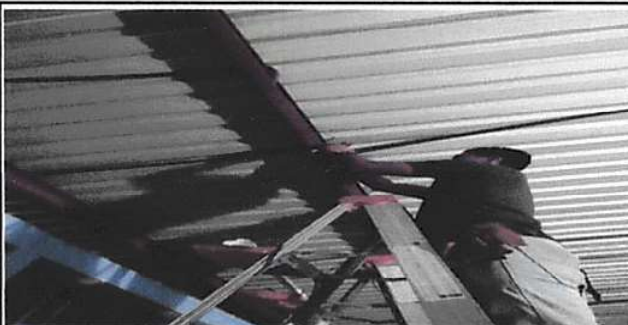
Foto 6: 17. Reparación de Sistema Eléctrico: 117.3 Sustitución de lámparas tipo LED.

Observación: Si es necesario se pueden agregar hojas adicionales y actualizar el número de hojas.