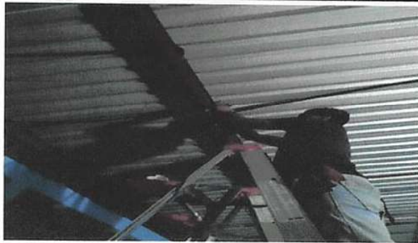
Foto1: 17. Reparación de Sistema Eléctrico: 17.4 Sustitución de focos ahorradores