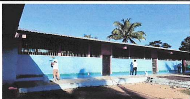
Foto 5: 9. Pintura en Muros Exteriores e Interiores: 9.1 Pintura en muros exteriores e interiores.