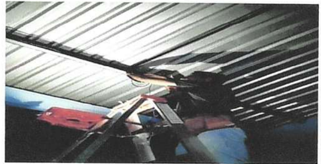
Foto 2: 17. Reparación de Sistema Eléctrico: 17.11 Reparación de cableado eléctrico