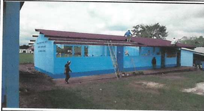
Foto1: Sustitución de lámina por lámkina troquelada alluzin calibre 26