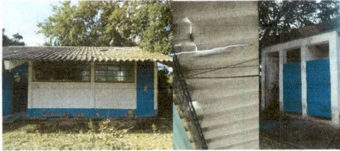
Foto 1: SUSTITUCION DE LAMINA, POR LAMINA TROQUELADA ALUZINC CALIBRE 26