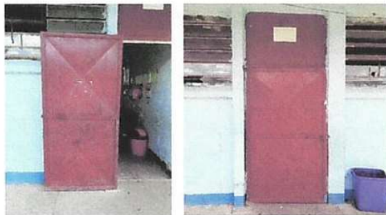
Foto 3: MANTENIMIENTO A ESTRUCTURA (LIJADO, CAMBIO DE TUBO, CEPILLADO, SUJECIONES, APLICACIÓN DE PINTURA)