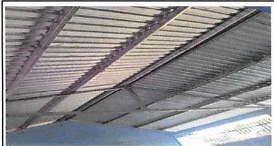
Foto1: Sustitucion de lámina troquelada aluzinc cal. 26