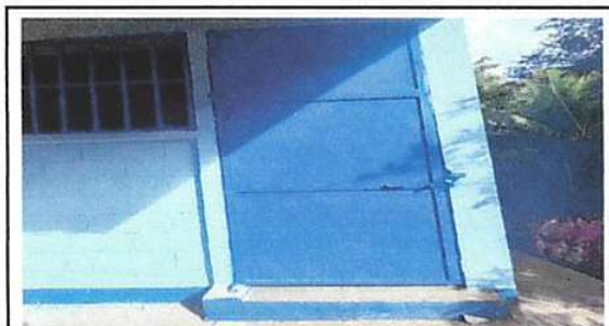
Foto 3 :Mantenimiento a estructura (lijado, cambio de tubo , cepillado, sujeciones, aplicación de pintura)