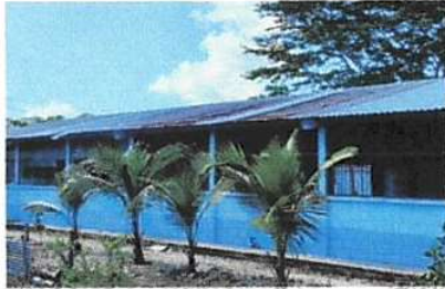
Foto1: CUBIERTA DE LAMINA. Sustitución de lamina, por lamina troquelada aluzinc, sustitución de capotes de lamina para lamina troquelada, sustitución de elementos de fijación.