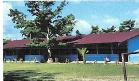
Foto 2: CUBIERTA DE LAMINA. Sustitución de lamina, por lamina troquelada aluzinc, sustitución de capotes de lamina para lamina troquelada, sustitución de elementos de fijación.