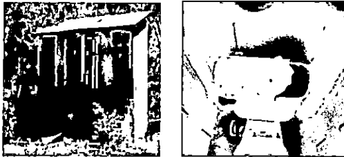
Foto 3: sustitucion de puertas, lavamanos, tasas, pintura y techo de baños