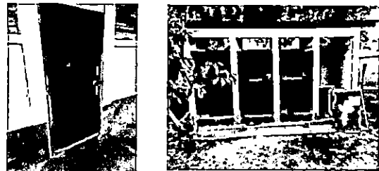
Foto 6: sustitución de puertas de metal con chapa, de aulas y servicios sanitarios

Observación: Si es necesario se pueden agregar hojas adicionales y actualizar el número de hojas.