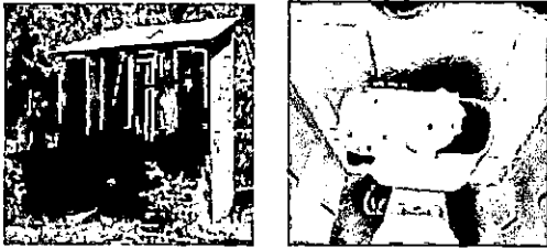
Foto 3: sustitución de puertas, lavamanos, tasas, pintura y techo de baños