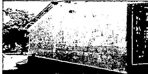
Foto 2: Pintura de muros exteriores e interiores de 7 aulas, dirección, cocinas, 2 bodegas y 2 modulos de baño.