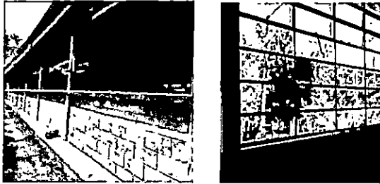
Foto1: Reparación de Ventanales de vidrio y divisiones de un módulo de 3 aulas, 2 bodegas, direccion