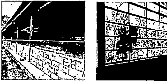
Foto1: Reparación de Ventanales de vidrio y divisiones de un módulo de 3 aulas, 2 bodegas, dirección