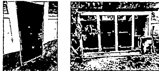
Foto 6: sustitución de puertas de metal con chapa, de aulas y servicios sanitarios

Observación: Si es necesario se pueden agregar hojas adicionales, se utiliza el número de hojas.