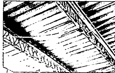
Foto 4: sistema electrico, sustitución de plafoneras, tomacorrientes, focos ahorradores, y cable electrico.