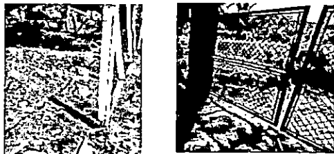
Foto 5: sustitucion de porton de metal y reparacion de malla galvanizada, con alambre de pua.