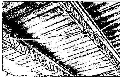
Foto 4: sistema eléctrico, sustitución de plafoneras, tomacorrientes, focos ahorradores, y cable eléctrico.