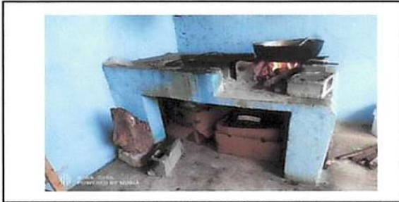
Foto 17: Sustitución de estufa rural (completa) incluye chimenea y plancha de metal