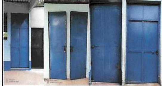
Foto 4: Mantenimiento a estructura (lijado, cambio de tubo , cepillado, sujeciones, aplicación de pintura)