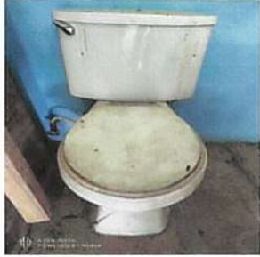
Foto1: Sustitución inodoro